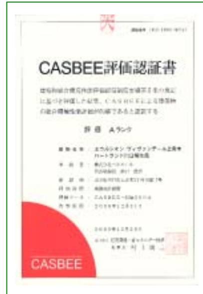
2006年1月31日竣工の当社建物のCASBEE評価認証書