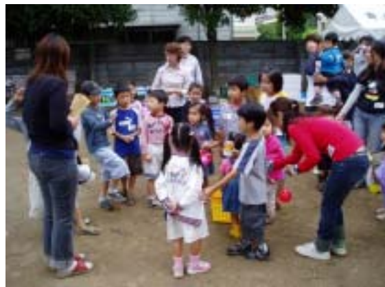
2004年8月28日、ファーストエココミュニケーションのコマ

当社管理マンションのエコルシオン・グランデール青木イースト・ウェストを中心としたリサイクルのネットワークがエコルシオンエコリサイクルネットワークであり、当社はネットワークのコーディネーターとして、参加者、地域店舗、協力企業、行政との協働により、資源のリユース・リサイクルを参加者が楽しく行うことで、環境活動の実践につながるように、継続的に企画・推進・実施することにより、ごみの減量と資源の循環を促進している。また同